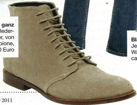
Dem Boden ganz nah Wildleder-Schnürer, von Piazza Sempione, ca. 320 Euro