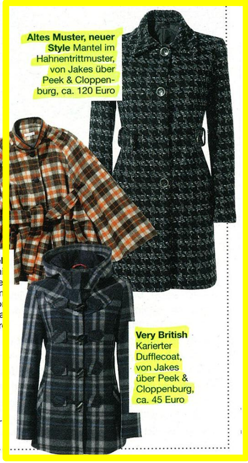
Altes Muster, neuer Style Mantel im Hahentrittmuster, von Jakes über Peek & Cloppenburg, ca. 120 Euro