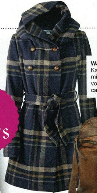
Warm umwickelt Kapuzenmantel mit Lederknöpfen, von Broadway, ca. 90 Euro