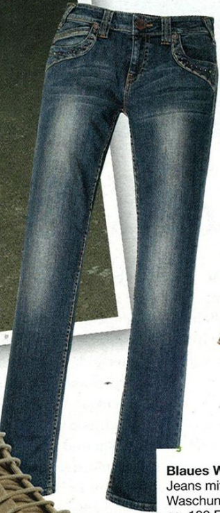
Blaues Wunder Jeans mit heller Waschung, von ATT, ca. 100 Euro

Dieser Winter wird fein kariert: Ob Kurzmäntel, Ponchos oder gemütliche Dufflecoats – alle tragen den angesagten Kästchen-Look spazieren. Den lieben auch die Stars