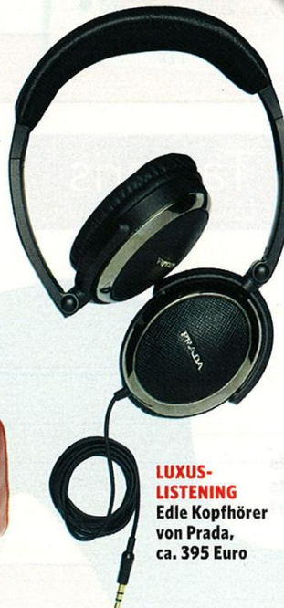
LUXUS-LISTENING Edle Kopfhörer von Prada, ca. 395 Euro