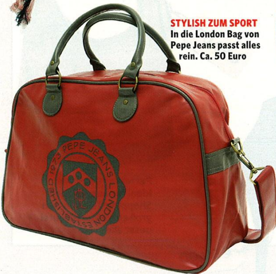
STYLISH ZUM SPORT In die London Bag von Pepe Jeans passt alles rein. Ca. 50 Euro