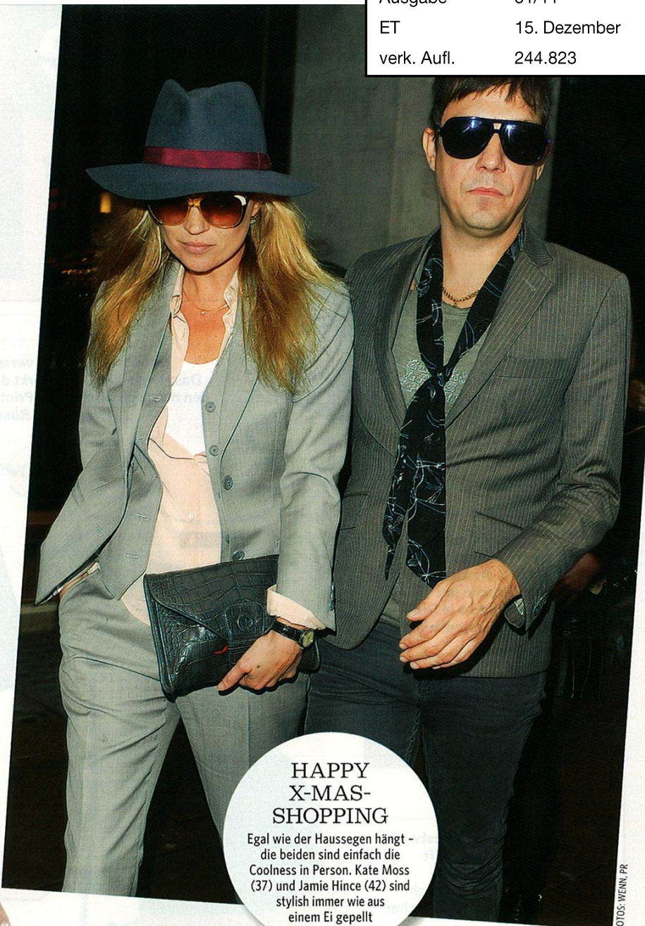
HAPPY X-MAS-SHOPPING Egal wie der Hausseggen hängt - die beiden sind einfach die Coolness in Person. Kate Moss (37) und Jamie Hince (42) sind stylish immer wie aus einem Ei gepellt