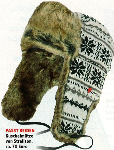
PASST BEIDEN Kuschelmütze von Strellson, ca. 70 Euro