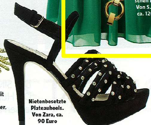
Nietenbesetzte Plateauheels. Von Zara, ca. 90 Euro