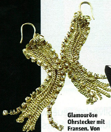
Glamouröse Ohrstecker mit Fransen. Von Tommy Hilfinger, ca. 49 Euro