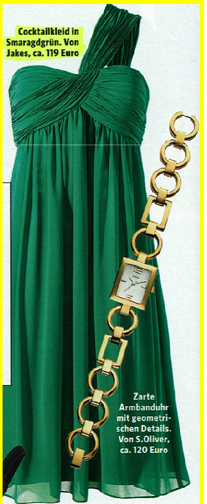
Zarte Armanduhr mit geometrischen Details. Von S. Oliver, ca. 120 Euro