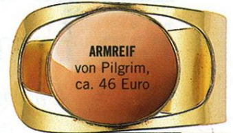
ARMREIF von Pilgrim, ca. 46 Euro