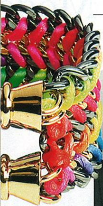
DOPPELARM BAND aus Satinbänder und vergoldetem Metall, von Bex Rox, ca. 220 Euro