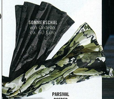
SOMMERSCHAL von Codello, ca. 60 Euro

»Die gewisse Coolness bringen jetzt Erdtöne von Kopf bis Fuß.«