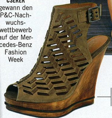
VACCHETTA- WEDGES von DKNY, ca. 210 Euro