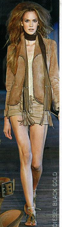
DIESEL BLACK GOLD