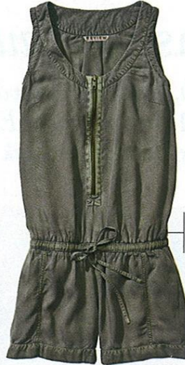
KURZ-OVERALL mit Reißver- schluss und Tunnelzug, von Review, ca. 35 Euro

»Punk-Style der 70er, Lingerie-Look und knallige Farben gehören in jeden Kleiderschrank.«